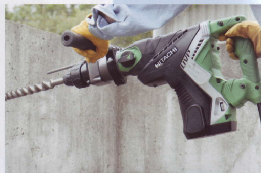
Boor-hakhamer DH50MRY, Hitachi Power Tools Netherlands