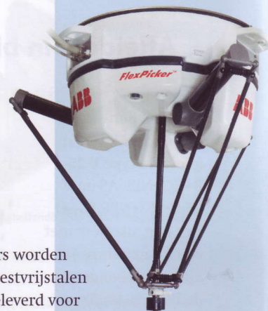
Nieuwe robot van ABB

ABB heeft de FlexPicker IRB360 geïntroduceerd. Deze nieuwe generatie Delta robots onderscheidt zich door hogere snelheden, een hogere belastbaarheid en een geringer ruimtebeslag. De robot is vooral geschikt voor belaad- en verpakkingsapplicaties. Vergeleken met de vorige generatie FlexPickers kunnen de nieuwe robots 50% meer belasting aan