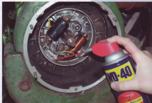
De Smart Straw van WD-40, WD-40 Company Nederland

WD-40 Company Nederland levert de Smart Straw van WD-40. Met de multispray WD-40 zijn stroef lopende mechanieken snel verdwenen. Het unieke in- en uitklapbare rietje op de Smart Straw laat kleine hoeveelheden gericht en gedoseerd op een klein oppervlak aanbrenen. Er kan ook een groot oppervlak in één keer mee worden behandeld. De allround olie van WD-40 is altijd en overal klaar voor gebruik. Het rietje van WD-40 werkt zelfs als de bus op zijn kop wordt gebruikt, en druppelt niet.